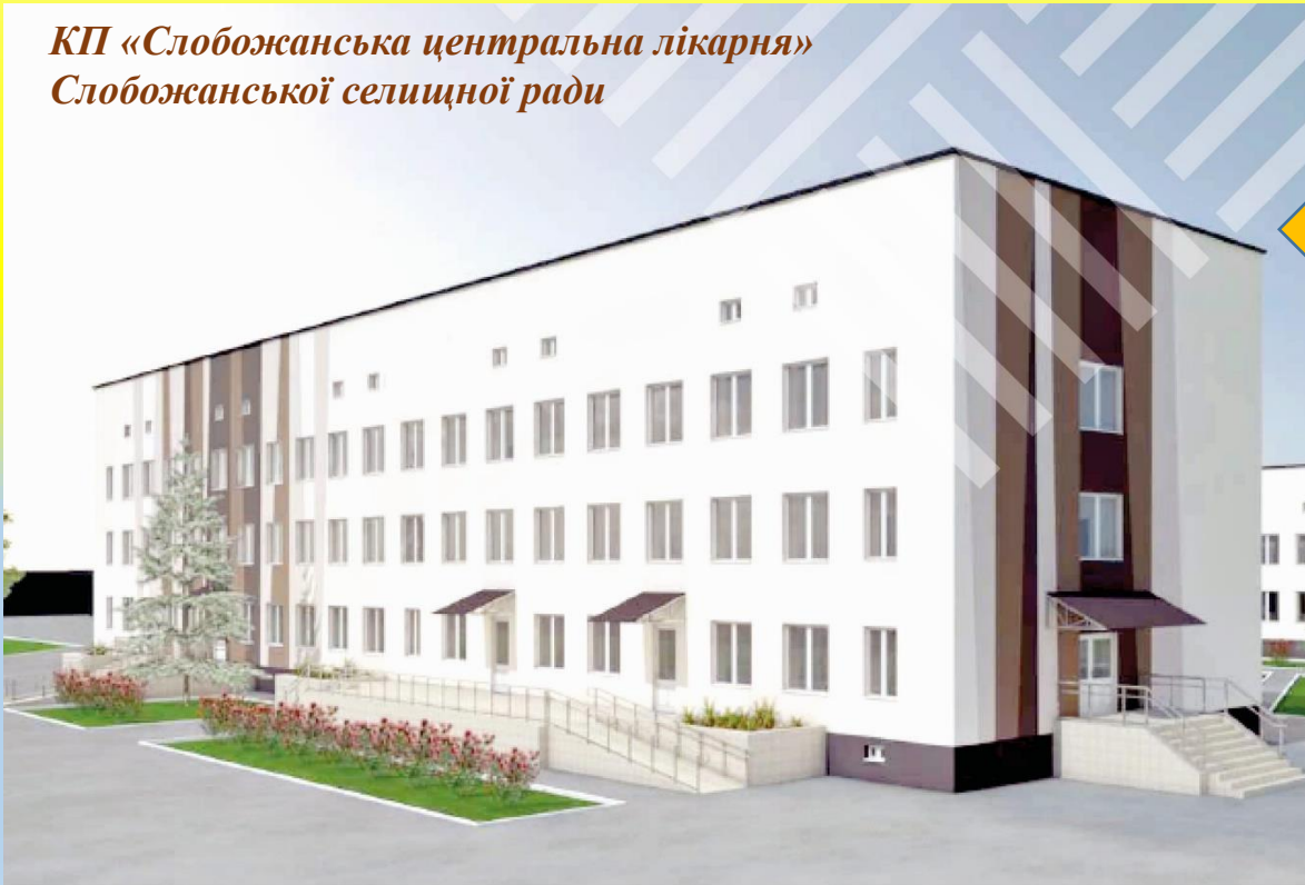
КП «Слобожанська центральна лікарня» Слобожанської селищної ради

Слобожанська селищна рада є засновником 2-х закладів охорони здоров'я